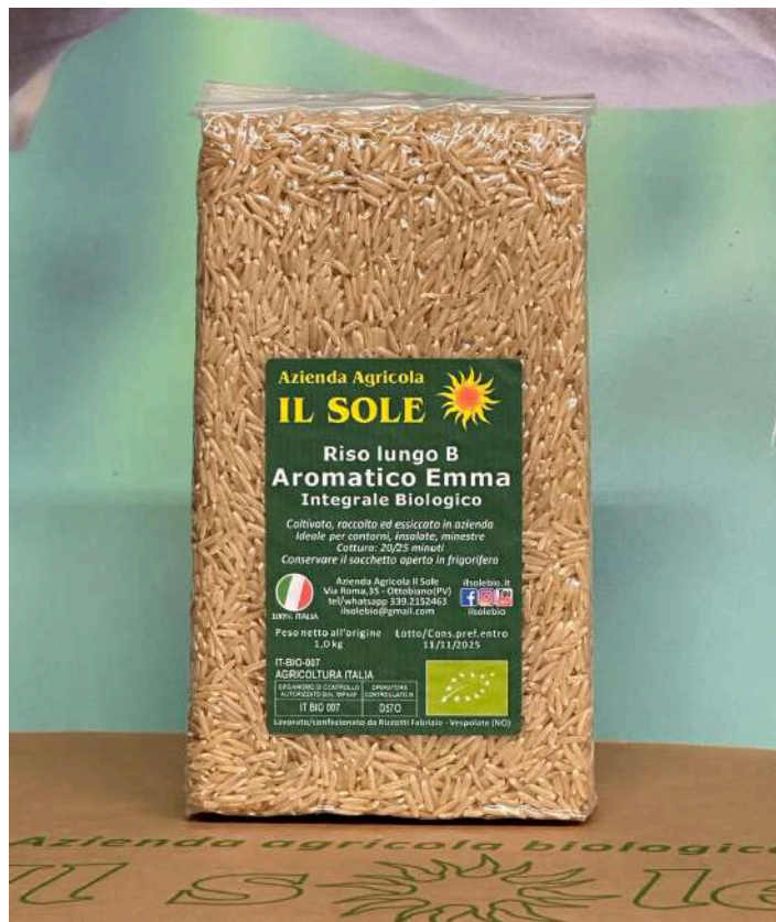
EMMA Integrale Bio 5,50€ al kg