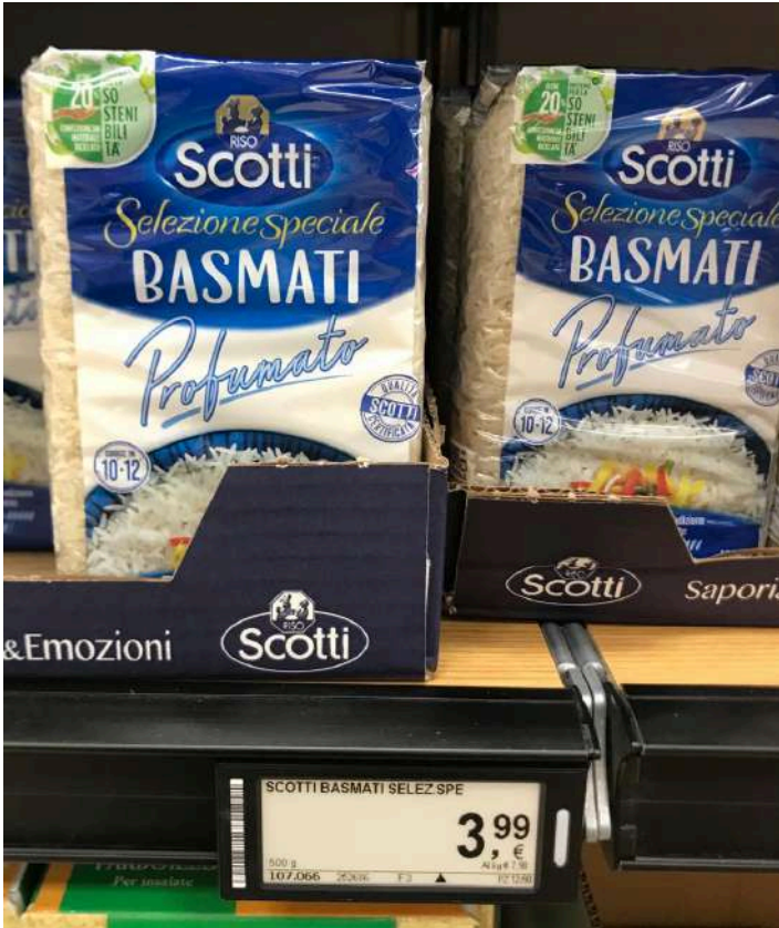
Convenzionale 7,98€ al kg