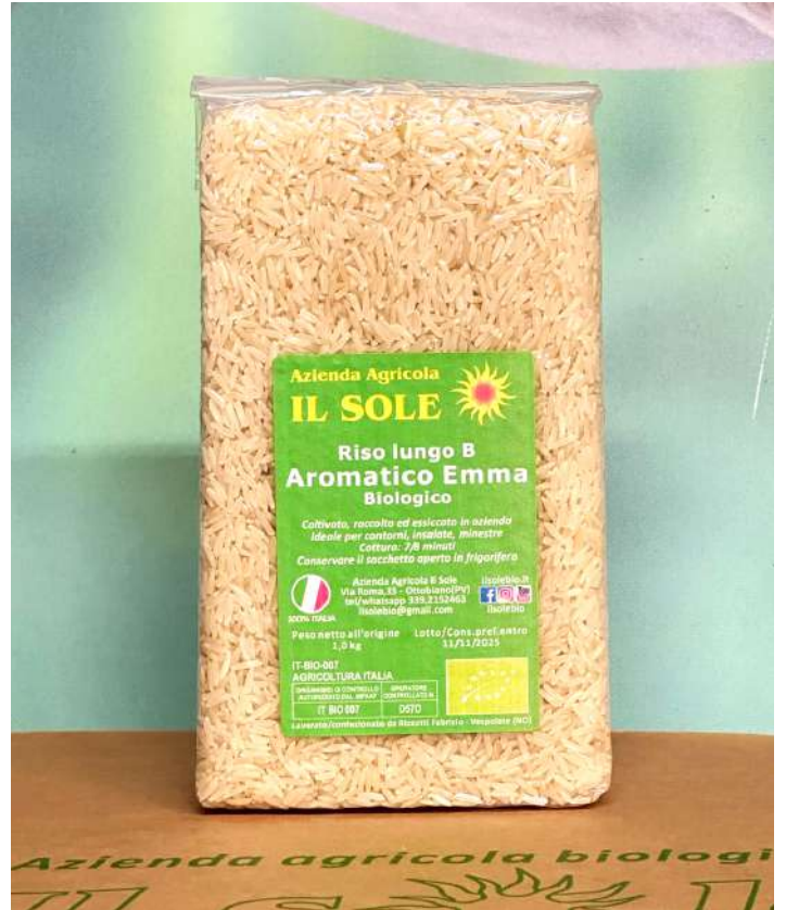
EMMA Bianco Bio 5,90€ al kg