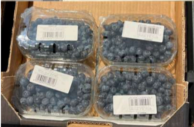
ORIGINE... INDEFINITA € 10,32 AL KG