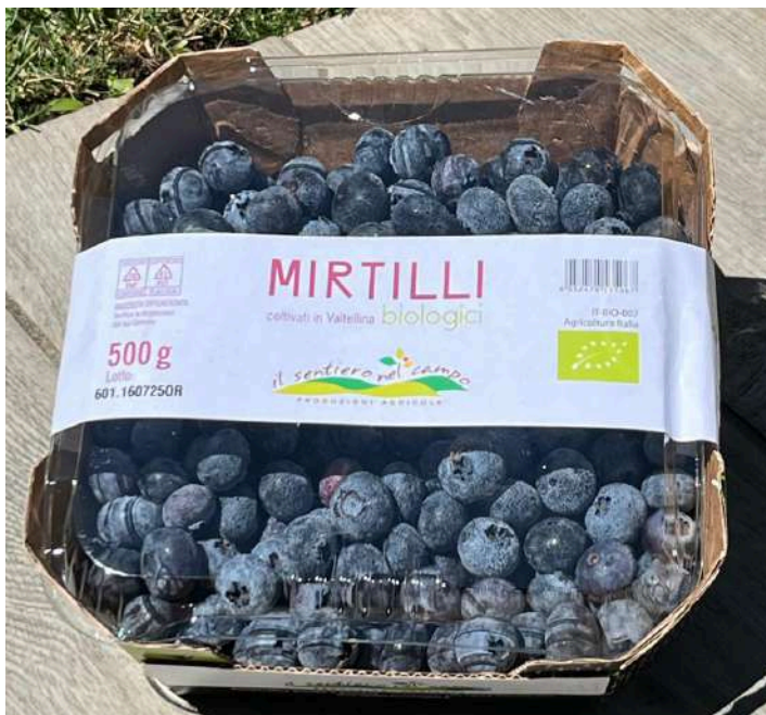
IL SENTIERO BIO € 9,40 AL KG