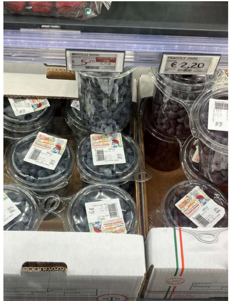
ITALIA" CONVENZIONALE €10,50 AL KG