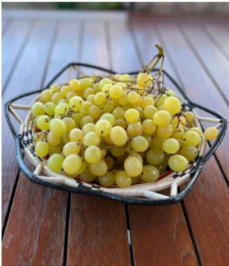
Lacalamita apirena BIO 3,10 al kg